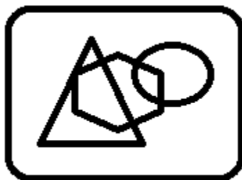
Рис. 1. Название рисунка

Таблицы, рисунки, схемы, графики должны быть пронумерованы и озаглавлены. Все рисунки должны быть четкими – 300 dpi в формате tif или jpg. Например: